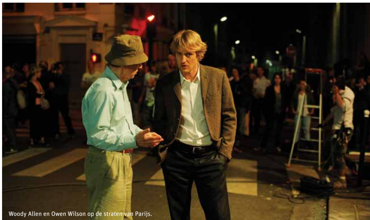
Woody Allen en Owen Wilson op de straten van Parijs.

Midnight in Paris – Woody Allen Naast de opening vanavond opent de film morgen ook het festivalprogramma in Terneuzen en is hij in de loop van het festival nog diverse malen te zien.