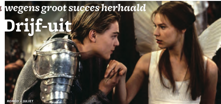
ROMEO + JULIET