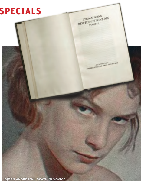
BJÖRN ANDRÉSEN | DEATH IN VENICE